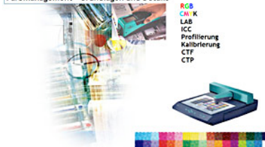
Farbmanagement - Grundlagen und Details