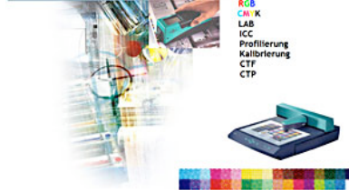
Farbmanagement - Grundlagen und Details